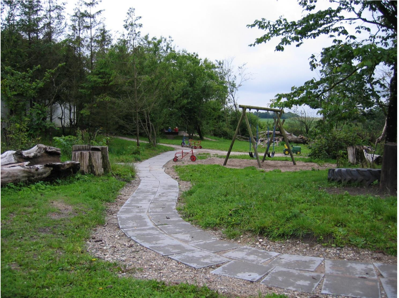
Udsnit af vores legeplads